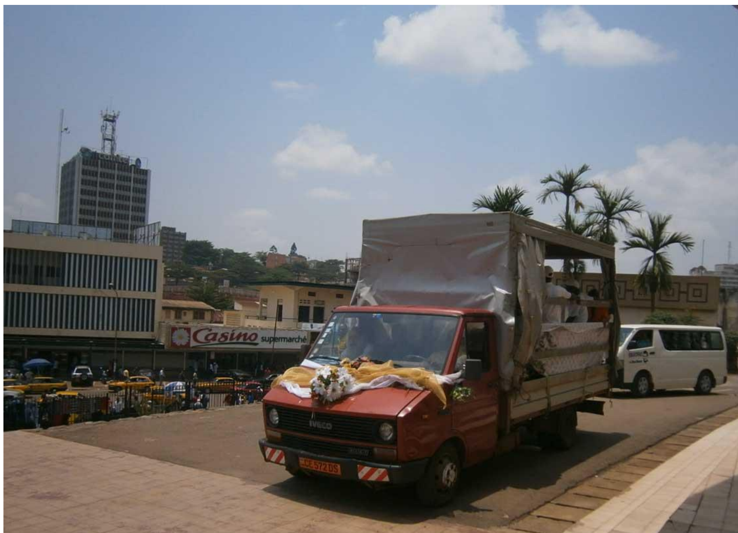
12 h 30 Arrivée de l'Urne de Don Bosco à l'esplanade de la Cathédrale de Yaoundé